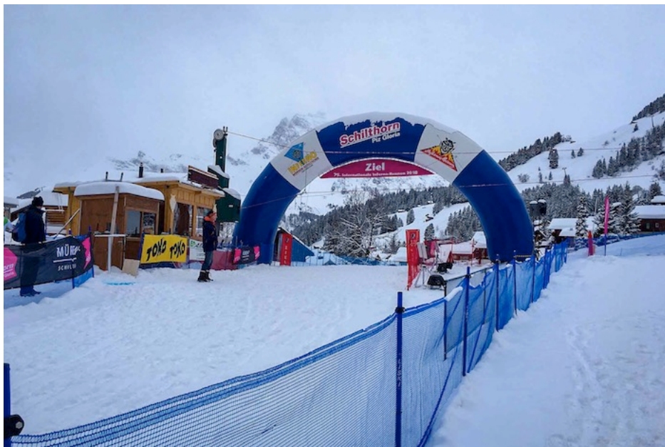
Der Zielbereich des Inferno-Rennes ist enger und kleiner als beispielsweise jener an den grossen Weltcup-Rennen.