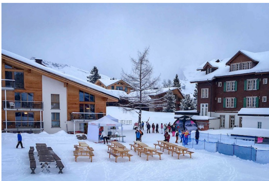
Nach dem erfolgreichen Abfahrtslauf kann man sich im Tal auf Holzbänken niederlassen und die mehr oder