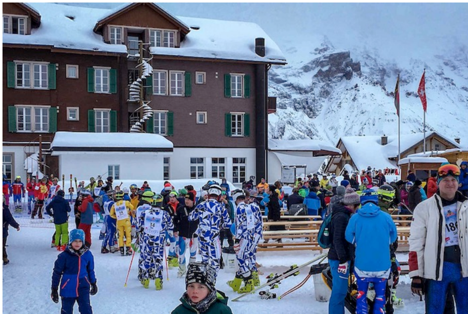
Mittlerweile haben sich die ersten Zuschauer und Teilnehmenden im Zielbereich gesammelt, um gemeinsam zu feiern.