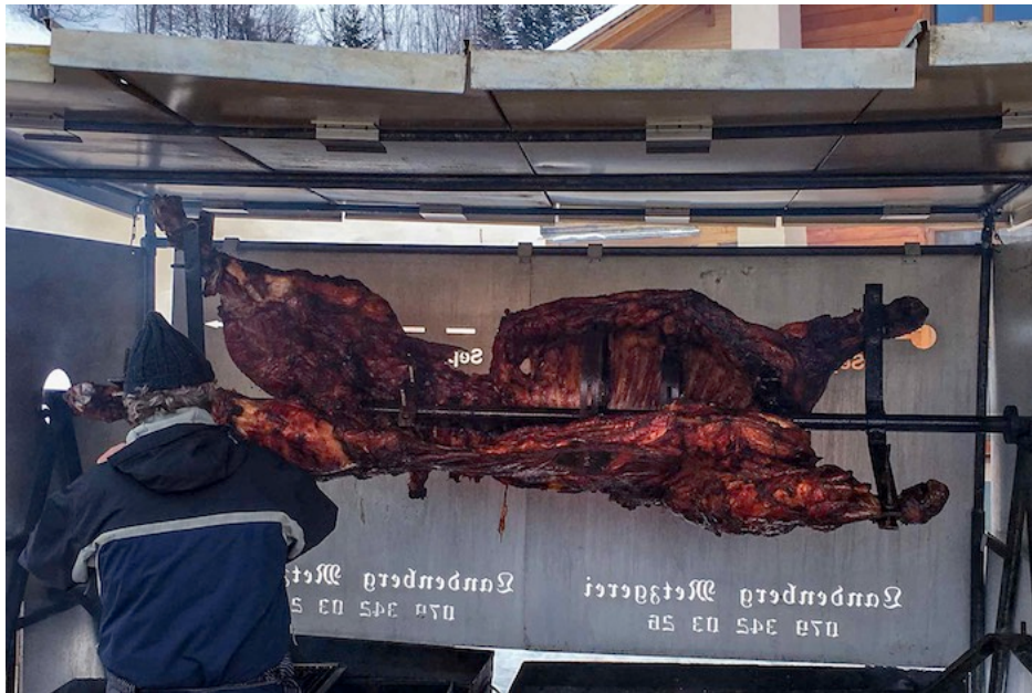
Ein Koch präpariert den Ochsen am Spiess. Genau das Richtige, nach 14,9 Kilometern Inferno-Abfahrt.