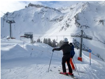
V západní části areálu pod Schilthornem se najdou nejroztáhlejší sjezdovky.

Sjezdování kolem Schilthornu znamená výběr z přibližně padesáti kilometrů tratí, mezi nimiž převažují středně až silně náročné sjezdy. Drsná černá sjezdovka, vinoucí se přímo z vrcholu, patří se sklonem místy přes 100 % mezi ty velmi proslulé, známé jsou i vyhlídky z mnoha míst areálu právě na zmíněnou trojici ikonických vrcholů.