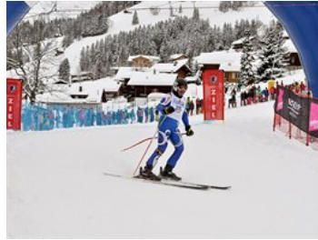
Další jezdec v cíli. A ještě jich přibudou stovky.

Průběh závodu, jehož start je položen jen těsně pod třítisícovou hranicí, je samozřejmě závislý na počasí. V posledních letech se několikrát stalo, že pořadatelé kvůli nebezpečným povětrnostním podmínkám snížili startovní pozici a závod tím byl zkrácen. Na závěrečné třetině sjezdu se zase mohou vyskytnout problémy s nedostatkem sněhu. Klíčová pasáž, „sjezd nahoru“, ovšem zůstává i tak zachována.