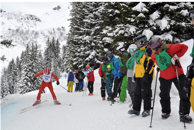
Stoupající pasáže přilákají nejvíce diváků. Tady se rozhoduje.

Právě tady se dá nejvíce ztratit – nebo naopak získat. Každý tu už trochu cítí nohy, které se najednou musí na pár desítek sekund přepnout do jiného režimu. Ideální samozřejmě je, tento protisvah s využitím setrvačnosti plynule vybruslit, to se ale každému nepodaří. Ne náhodou se na tomto úseku koncentrují špalíry diváků.