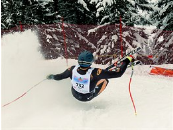
Hlavně ve spodních partiích už únava bývá veliká.

Vzhledem k tomu, že se startuje v desetisekundových intervalech, dochází na trati samozřejmě k předjíždění. Ve stoupajících úsecích se dokonce mohou objevit i menší skrumáže. Platí striktně pravidla FIS, tedy zodpovědnost má předjíždějící lyžař. Nepsaným zvykem je včas zahalekat na předjížděného stranu, po které ho / jí chcete předjet, tedy „rechts“ nebo „links“.