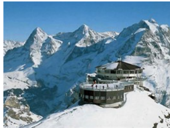
Restaurace Piz Gloria na vrcholu Schilthornu. V pozadí Eiger, Mönch a Jungfrau

Sjezdařský areál je poměrně „roztahaný“, s řadou spojovacích pasáží, a je mimořádný svojí polohou. Do vesnice Mürren, do níž se sbíhá většina sjezdovek, totiž z údolí nevede žádná silnice a zespoda se tam nemůžete dostat jinak než lanovkou. Díky tomu v Mürrenu nejezdí, s výjimkou nepočetné komunální obsluhy, žádná auta . Nejen „hlavní třída“ v obci proto i ve vrcholné sezoně dýchá báječnou pohodou bez spalovacích motorů a v noci, když utichne i lyžařský ruch, tu můžete zažít ohlušující ticho.