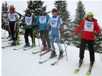
Na startu se účastníci řadí podle startovních čísel. Dostavte se včas, vyjíždí se co deset sekund.

Britům se akce zjevně zalíbila a další rok se jelo znovu. Přesto však dlouho nic nenasvědčovalo tomu, že se Inferno Rennen má stát masovou akcí, na níž budou přijíždět lyžaři z desítek zemí.