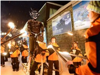
V předvečer závodu prochází Mürrenem „ďábelský průvod“.