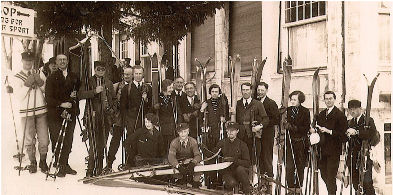
Historičtí účastníci závodu Inferno Rennen. Fotografie byla pořízena pravděpodobně v roce 1928, tedy během úplně prvního ročníku. Tehdy se chodilo na start pěšky s lyžemi na ramenou.

Ten název odrazuje – Inferno Rennen neznamená nic jiného než „Ďábelský závod“. Ale nenechte se mýlit, nejdelší amatérský sjezdařský závod světa si může zkusit každý alespoň trochu zkušený lyžař. Letos se v divokých kulisách Bernských Alp v srdci Švýcarska jel již 75. ročník.