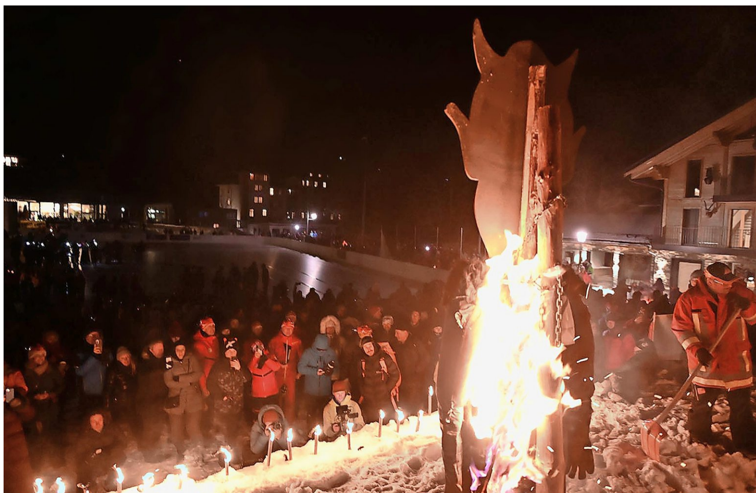
Der Teufel geht in Flammen unter und die Geister sind vertrieben. Auf dass es ein unfallfreies 79. Infernorennen geben wird.